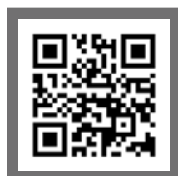
トータル フィットネスクラブ アックアセレーナ

＼ DAS合同発表会へのご参加ありがとうございます！ 入会・体験・見学については各団体にお問い合わせください！ ／